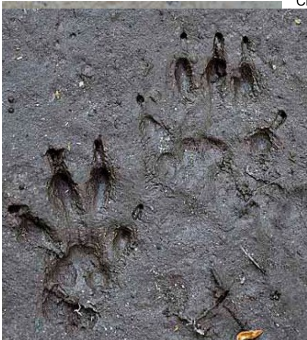
Crotte de hérisson