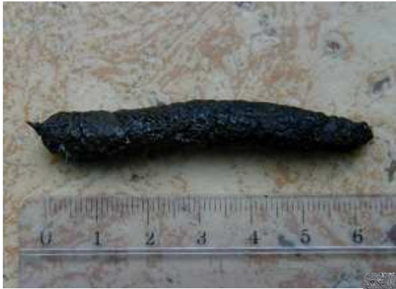
Crotte de hérisson