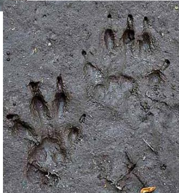
Traces de hérisson